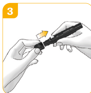
Doe de dop weer op de pen