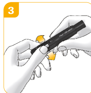
Lancet vervangen Beweeg het hendeltje heen en weer voor een nieuw lancet