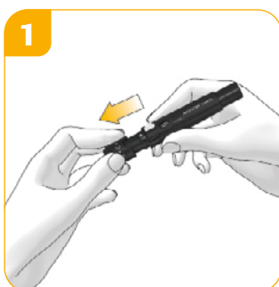
Verwijder de dop