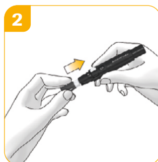
Plaats de lancethouder