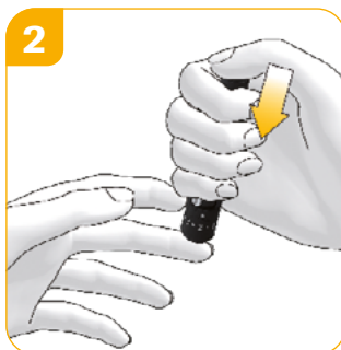
Bloeddruppel verkrijgen Aanspannen en prikken in 1 klik