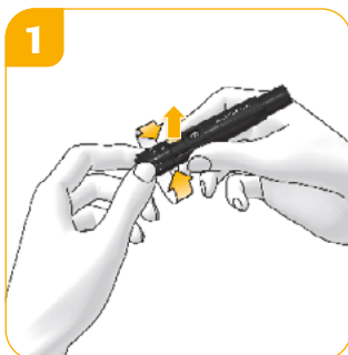
Prikdiepte instellen Draai de instelling voor de juiste prikdiepte